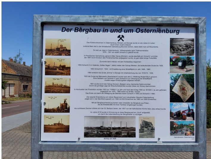
Denkmal für den Osternienburger Bergbau