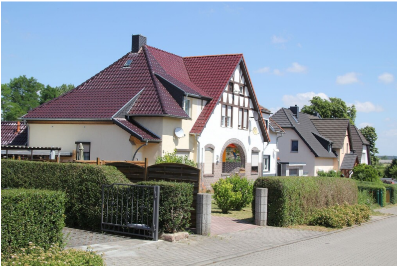
Werkssiedlungen Osternienburg - Blick in die Karl-Liebnecht-Straße