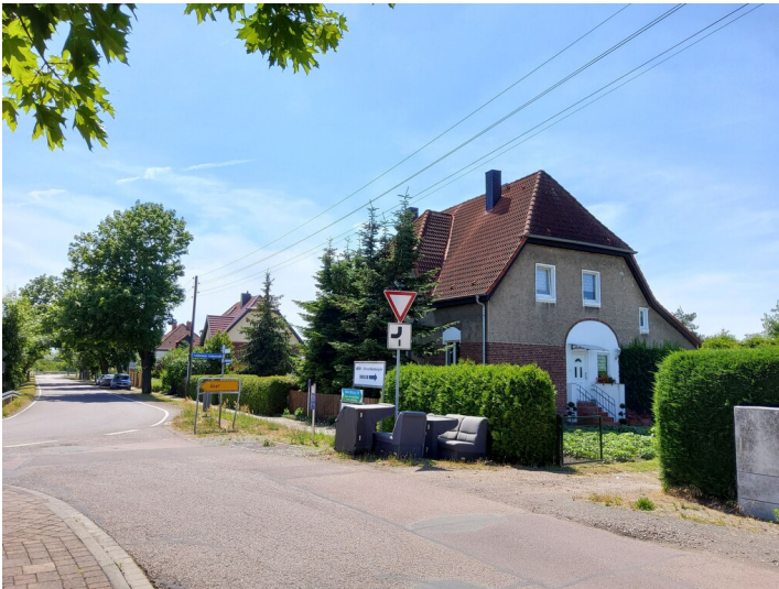
Siedlung des ehemaligen Braunkohlenwerks Osternienburg-Trebbichau - Hausnummer 15