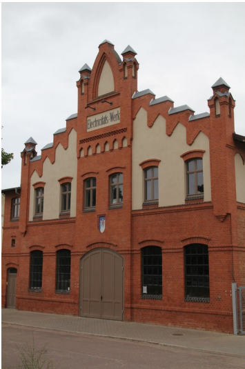
Elektrizitätswerk Aken (Elbe)