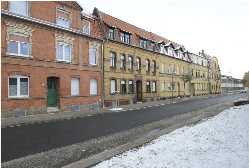
Steinzeugfabrik Fa. Paasch & Schwarz - Holzweißiger Str. 1-3 mit Greppiner Klinkern