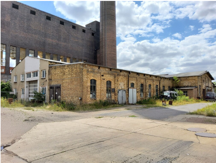
Kraftwerk Bitterfeld - Blick in Richtung Südwesten auf Teile des Kraftwerks und den Schornstein