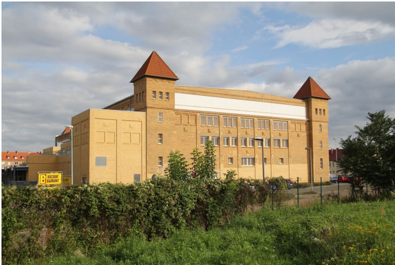
Produktionsgebäude der Bitterfelder Steinzeugwarenfabrik - Ansicht von der Röhrenstraße