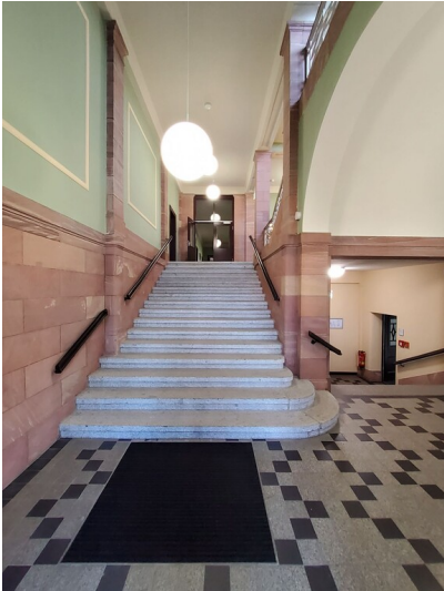
Verwaltungsgebäude der IG Farbenindustrie AG