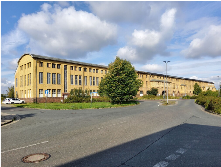
Chlorwerk II