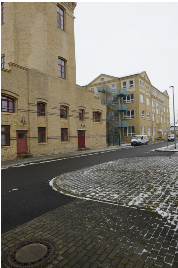
Verwaltungsgebäude der AGFA in Greppin