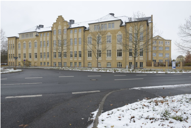
Eingangsgebäude der AGFA in Greppin