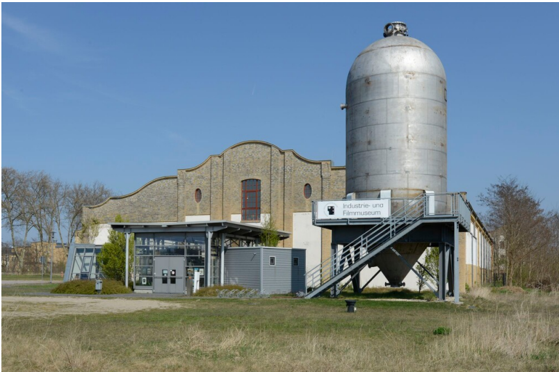
Begießerei der Agfa Filmfabrik