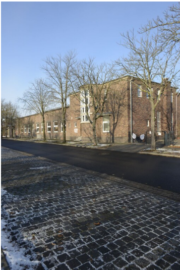
Kasino der Agfa Filmfabrik