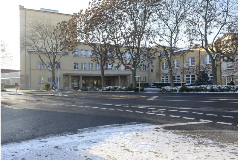
Kulturhaus Wolfen