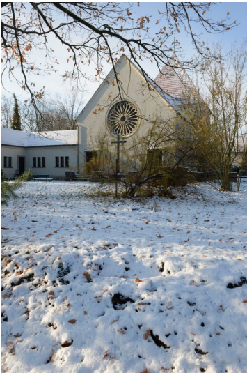
Katholische Kirche Heilig-Kreuz Wolfen