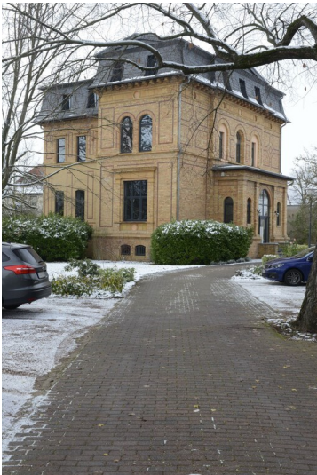
Direktorenwohnhaus der Greppiner Werke