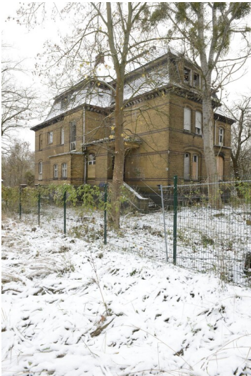
Direktorenwohnhaus der Farbenfabrik Greppin