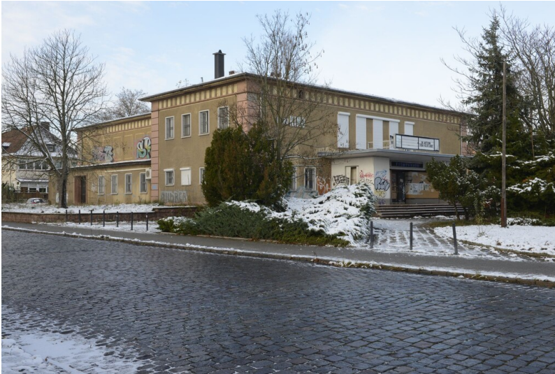
Kino Wolfen