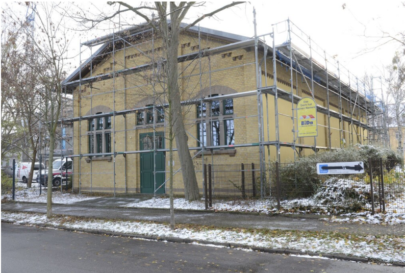
Turnhalle Wolfen