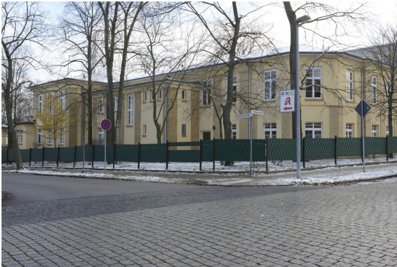
Wohlfahrtseinrichtungen der AGFA