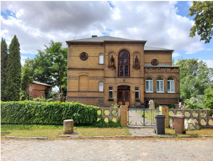
Fabrikantenvilla Roitzsch