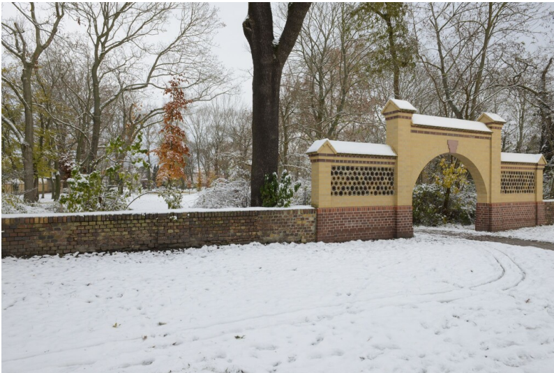
Gutspark Roitzsch