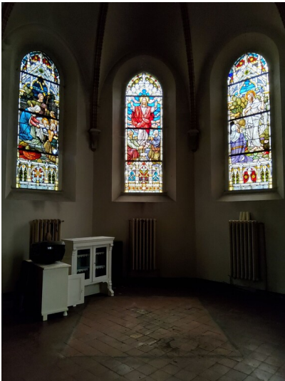
Bauermeister Gedächtniskirche Deutsche Grube - Stifterfenster der Familien Bauermeister