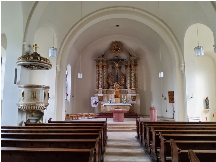
katholische Kirche St. Joseph