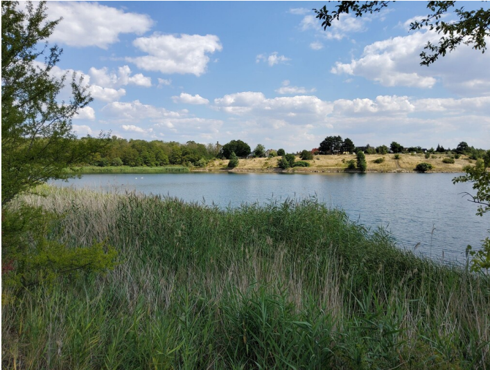
Postgrube - Nordöstlicher Teil der Postgrube, als Badesees genutzt