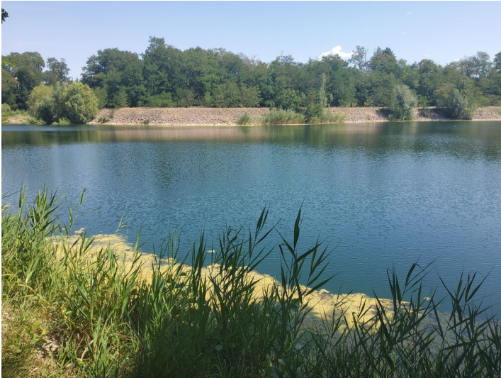
See Richard II - Blick auf die östliche Böschung