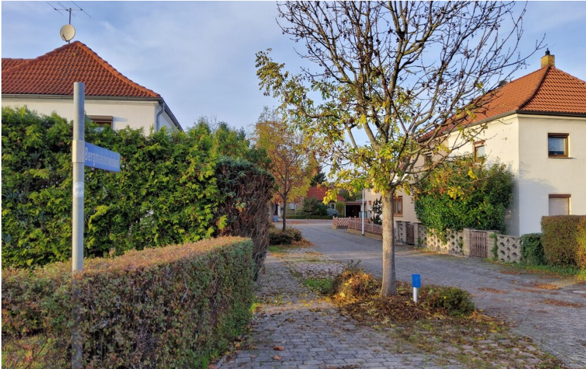
Straßenname Bergmannswinkel - Blick in die Straße "Bergmannswinkel"