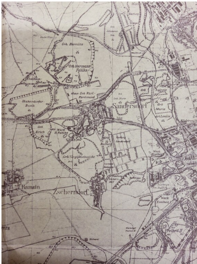
Tagebau Vergißmeinnicht - Tagebau Vergißmeinnicht auf einem Plan von 1950 (Kreismuseum Bitterfeld Sig. VIII C 905) Fotograf/Urheber: NAME FEHLT