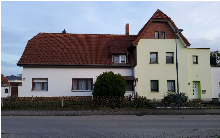
Wohnhäuser in ehemaligen Gebäuden der Grube Vergißmeinnicht