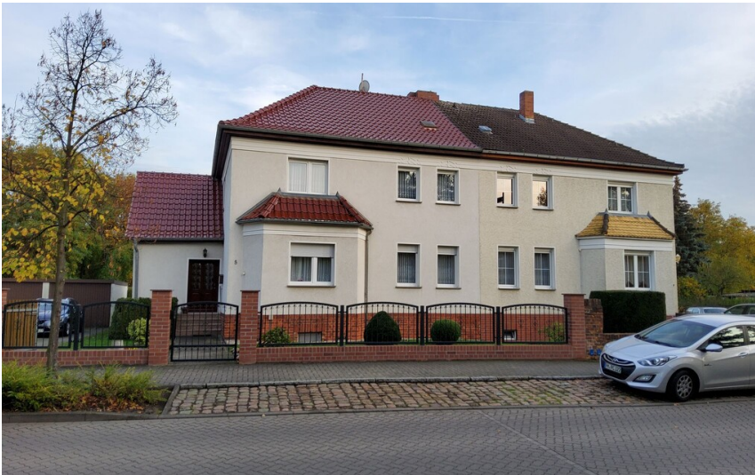
Beamtenhäuser der Louisengrube - Nummer 5 und 7