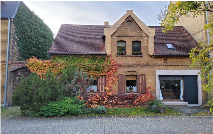
Wohnhaus Fam. Braust