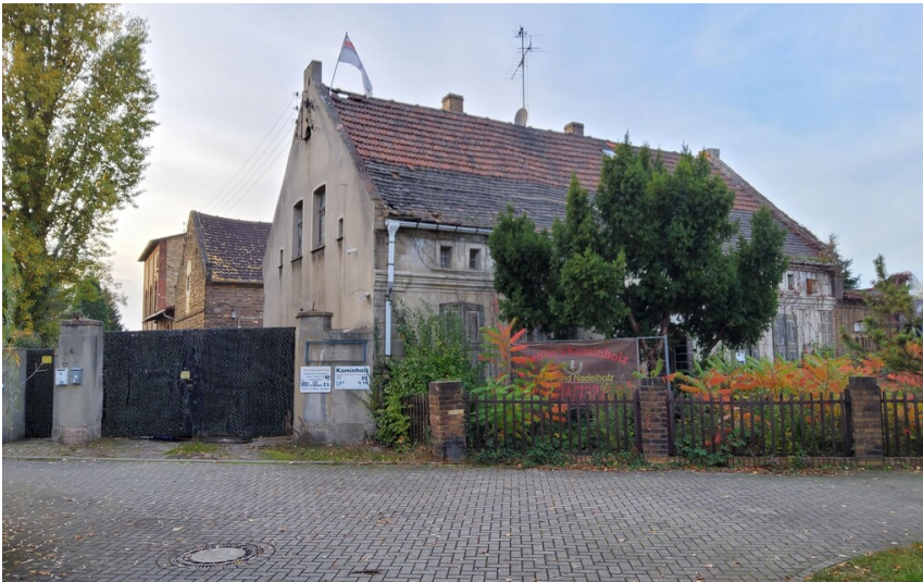
Nasspresskohlensteinanlage Möhring, später Syrupfabrik - Blick von der Ramsiner Straße auf das Gelände in Richtung Priioduktionsgebäude (im Hintergrund)