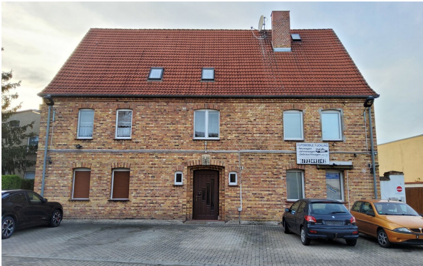
Gasthof Vergißmeinicht - Südostansicht, Hauptfassade zur Ramsiner Straße