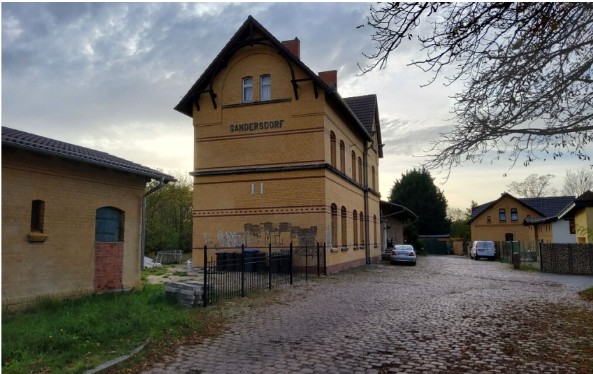
Bahnhof Sandersdorf - Ostfassade und Blick auf den Vorplatz