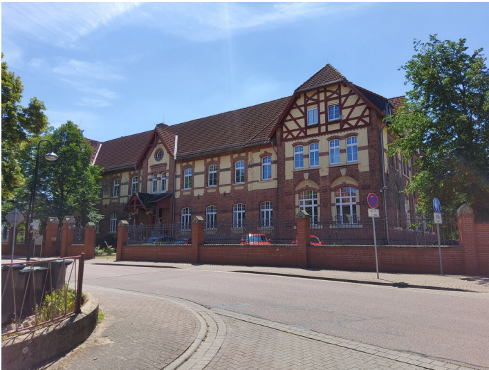
Ledigenwohnheim ""Casino"" - Hauptansicht mit Blick aus der Ringstraße