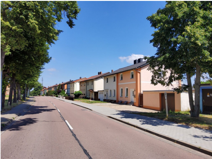
Werkssiedlung Osternienburg - Blick entlang der Ernst-Thälmann-Straße nach Norden