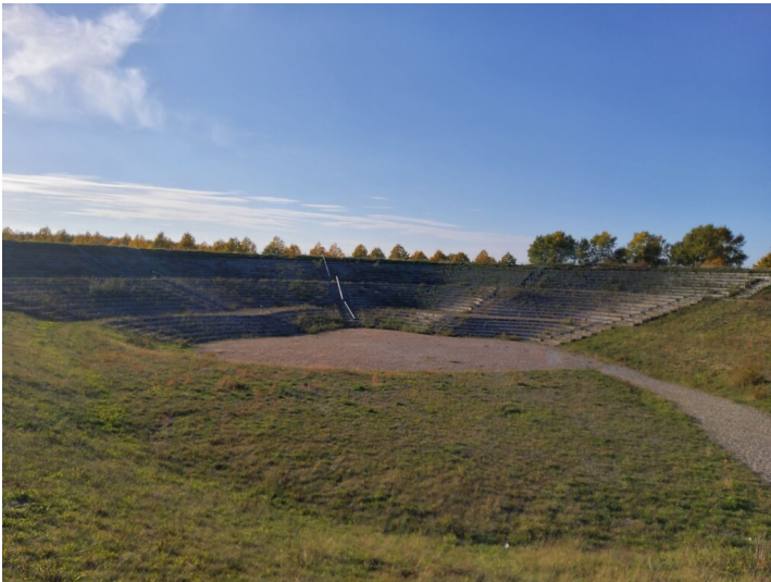
Agora 2000 - Blick vom Eingang im Osten auf die Sitztribüne in Westen