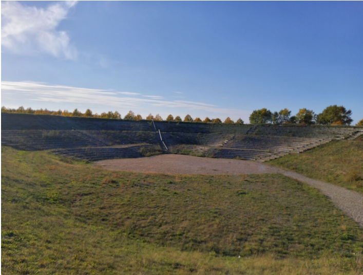
Agora 2000 - Blick vom Eingang im Osten auf die Sitztribüne in Westen