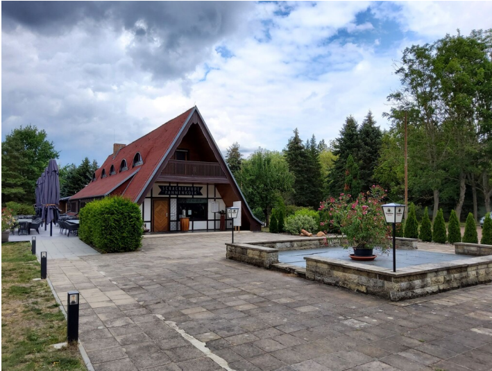
Schachtbaude des BKK Bitterfeld - Gebäude "Schachtbaude", betrieben als Restaurant