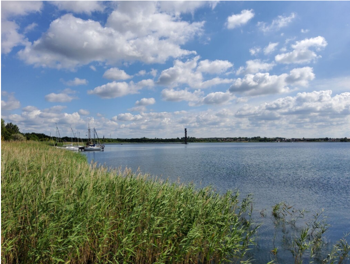
Pegelturm Goitzschesee - Blick von der Bernsteinvilla auf den Pegelturm