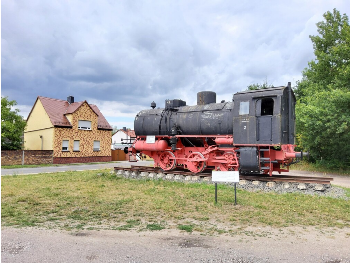
Dampfspeicherlokomotive als Objekt der Traditionspflege - Standort der ""Feuerlosen"" mit Erinnerungstafel