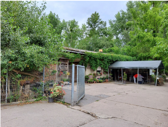
Fischzucht Muldenstein - Fischräucherei und Imbiss auf dem Gelände