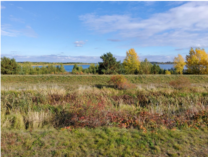
Seelhauser See