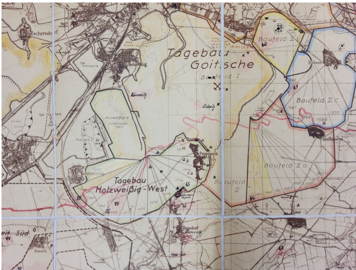
Tagebau Holzweißig West - Tagebau Holzweißig -West auf dem Übersichtsplan der BKW Einheit von 1963 (Kreismuseum Bitterfeld VIII C 13780)