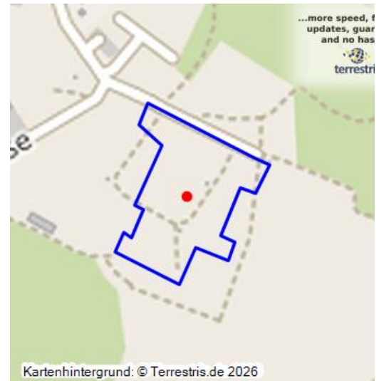
Altstandort Brikettfabrik Holzweißig - Lageplan Brikettfabrik Grube Leopold AG Werk Holzweißig von 1913 ( Kreismuseum Bitterfeld Sig. VIII C 1594) Fotograf/Urheber: NAME FEHLT

Altstandort der überregional bedeutenden Brikettfabrik der Grube Leopold Werk Holzweißig; 1909–31.03.1993; Wasserzufuhr vom Strengbach, zwei Kesselhäuser mit Dampfschornsteinen, Zechenhaus, Kühlanlage, Pressenhaus mit zuletzt 21 Pressen, auch Nasspresse; Kohle aus Grube Leopold I und II mit Kettenbahn herantransportiert; im letzten Betriebsmonat (Oktober 1990) 76 800 t Briketts, Stilllegung beendete die Brikettherstellung im Bitterfelder Gebiet; heute Solarfeld.