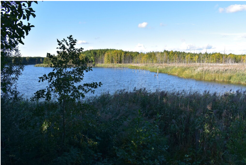
Holzweißiger Ost-See/Zöckeritzer See - Blick auf den See vom Vogelbeobachtungsstand an der Südost-Ecke; Der Zöckritzer See ist unzugängliches Vogelschutzgebiet