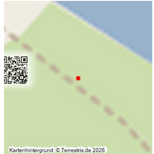
Gedenkstein Waldhaus und Wassermühle Zöckeritz - Auf dem Plan der ehemaligen Grube Leopold um 1930 ( Kreismuseum Bitterfeld Sig. VIII C 528) ist die Mühle Zöckeritz als Wüstung korrigiert

Gedenkstein am ehemaligen Standort Waldhaus Zöckeritz; nach 1956–dato; Wassermühle Zöckeritz 1264 erwähnt, 1895 als Gasthaus neu aufgebaut, 1948 als Kindererholungsheim genutzt, 1956 überbaggert; das Waldhaus Zöckeritz war ein beliebtes Ausflugsziel im 700 ha großen Mischwald Goitsche, der dem Tagebau weichen musste und namensgebend für ihn war