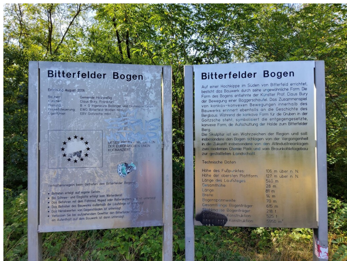
Aussichtspunkt Bitterfelder Bogen - vor dem Bogen aufgestellte Infotafel