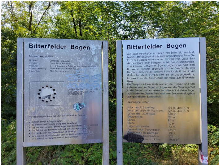
Aussichtspunkt Bitterfelder Bogen - vor dem Bogen aufgestellte Infotafel