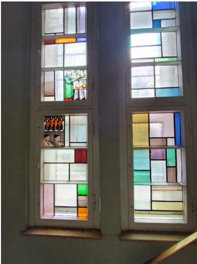
Rathaus Holzweißig