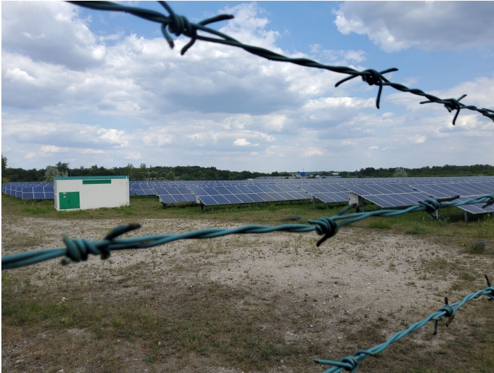
Tagebau Hermine (bei Greppin) - Unzugänglicher Bereich mit Solarkraftwerk Gleisdreieck Bitterfeld 10MW