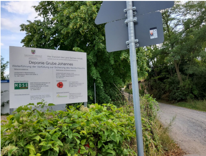
Tagebau Johannes Nr. 6 (ab 1871 Greppiner Werke)